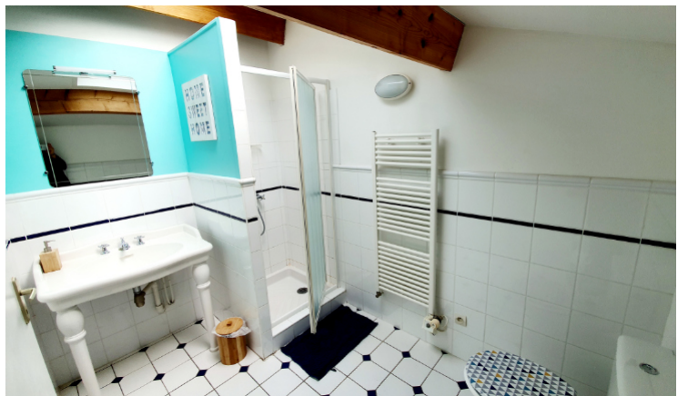
La salle de bain avec douche, lavabo et toilettes