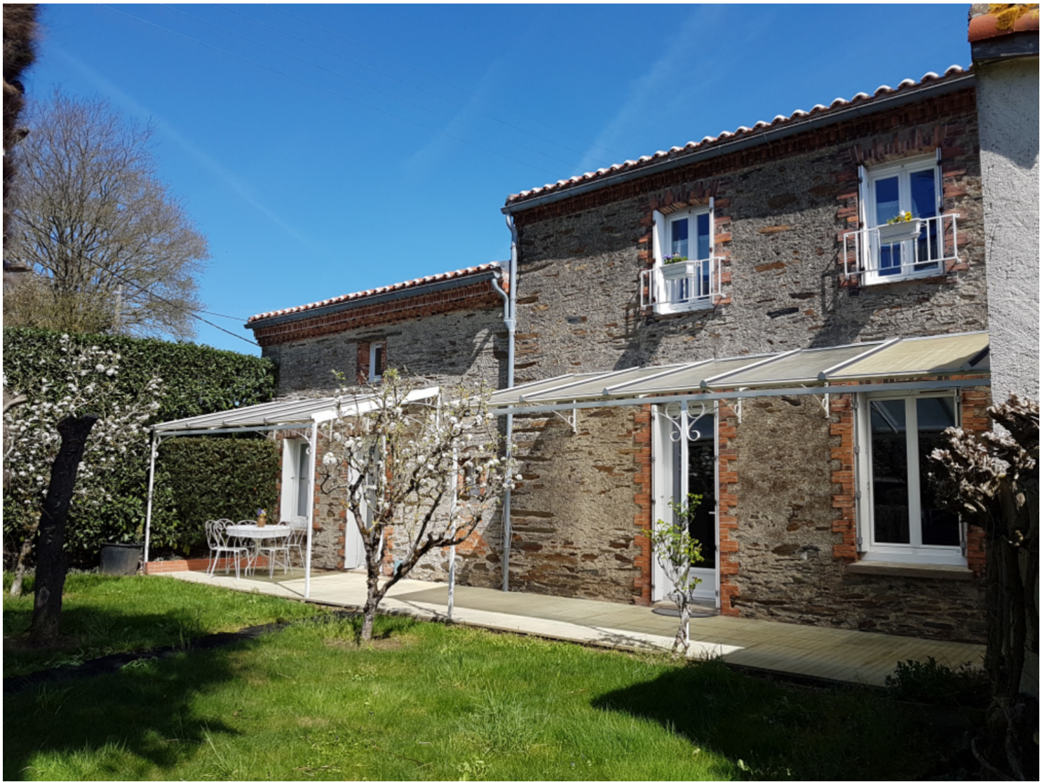
Le gîte du jardinier avec son jardin clôturé.