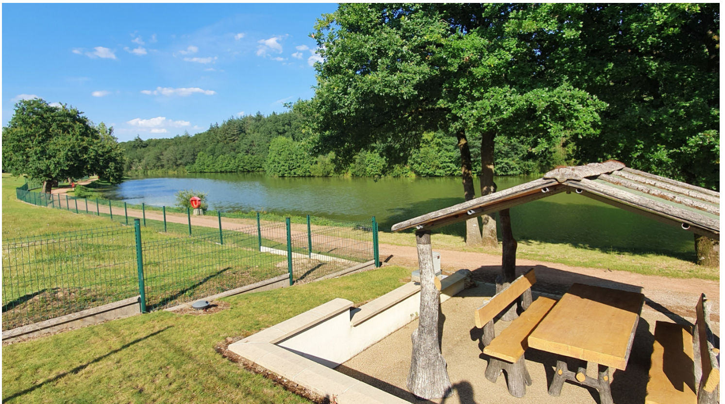
Accès au fond de l'étang du Domaine Les 3 Rivages pour pêcher, se promener, pique-niquer sous les paillotes, etc.